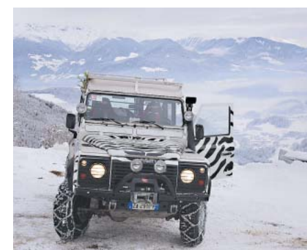
Vierradantrieb ist obligatorisch.

Das Haus selbst, mit den unregelmäßigen, handgehackten Lärchenholzschildeln auf dem Dach, ist ein gelungenes Beispiel für den Umbruch, der gerade vielerorts in den Bergen stattfindet. Aus