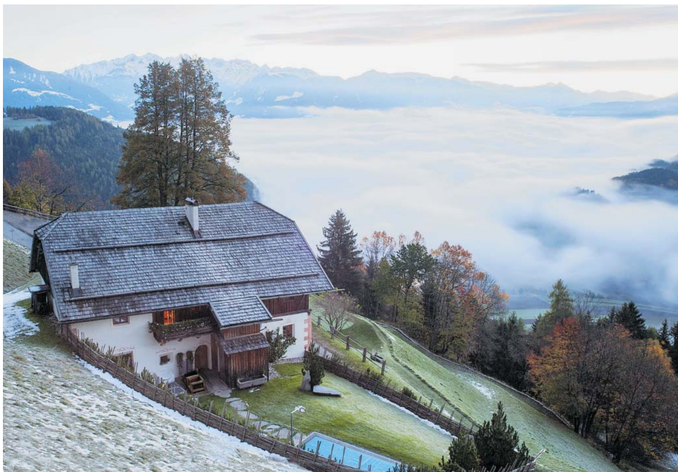
Hof über den Südtiroler Bergen: Die einsame Lage (und der beheizte Pool) macht diesen Ort so kostbar.