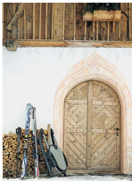
Gepflegt wie ein Denkmal, sogar die Türen

Die Lodge kann – Minimum: für drei Tage – das ganze Jahr über und nur als Ganzes gemietet werden. Kosten pro Tag ab 2200 Euro www.sanlorenzomountainlodge.com . Nächster Skiberg ist der wie ein Panettone gewölbte Kronplatz gegenüber (zwanzig Minuten); größeres Skigebiet: Dolomiti Superski (vierzig Minuten).